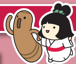
はにかしむけ 埴輪氏武 したみこちゃん 「歴史の里」マスコットキャラクター