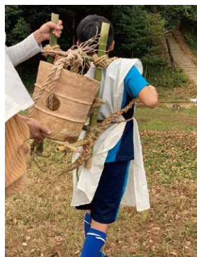
背負子(しょいこ)で埴輪を運ぶ

※約1km埴輪を運びながら歩きます。 ※体験は新型コロナウイルス対策を十分に行った上で実施します。