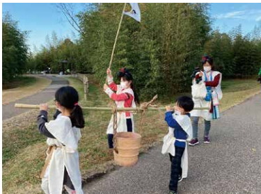
天秤棒(てんびんぼう)で埴輪を運ぶ