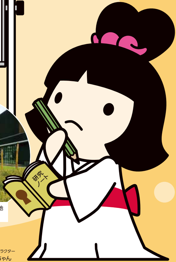
「歴史の里」 マスコットキャラクター したみこちゃん